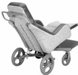
ELYSEE (chassis roulant)