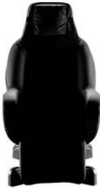
PREMIUM ESPRIT BIEN-ETRE

Fauteuils coquille destinés au maintien postural des personnes dépendantes nécessitant l'aide d'un accompagnant